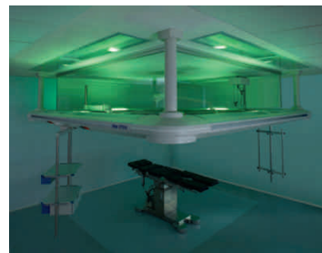
Операционный зал с подвесной системой OPERA