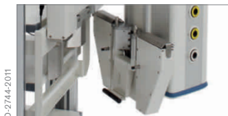
Mova Cart и MediaDocking на консоли Movita

Опция MediaDocking для стойки Mova Cart или анестезиологической станции Primus поможет оптимизировать рабочие процессы. Все соединения, необходимые для работы выбранного оборудования, такие как подача газов, электричества, передача видео и данных, реализуются через интерфейс системы MediaDocking. Эта функция позволяет сэкономить время и обеспечивает единое подключение для всего комплекса оборудования при стыковке мобильной стойки Mova Cart или станции Primus с потолочной консолью. При помощи подъемного устройства можно поднять подключенное оборудование с пола и установить в удобном для работы положении. Применение этой опции для многофункциональных операционных залов означает реальные улучшения с точки зрения эргономики, эффективности и гигиены.