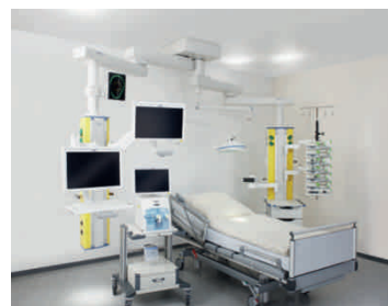
Палата интенсивной терапии с потолочными консолями Movita/Agila