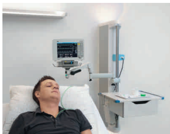
Палата неотложной помощи с вертикальной настенной консолью GeminaDUO