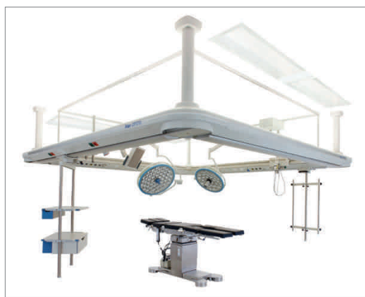
Потолочная консоль OPERA