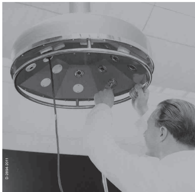
Потолочная консоль Dräger, 1961 г.

Знания о том, как происходят рабочие процессы в клинике, помогают нам оптимально интегрировать оборудование в клинические отделения. Наш профессиональный опыт поможет при создании рабочего пространства в проектах переоснащения, реконструкции или строительства больниц. Все наши изделия предусматривают возможность изменения конфигурации рабочего места в будущем путем замены составных элементов и использования дополнительных принадлежностей.