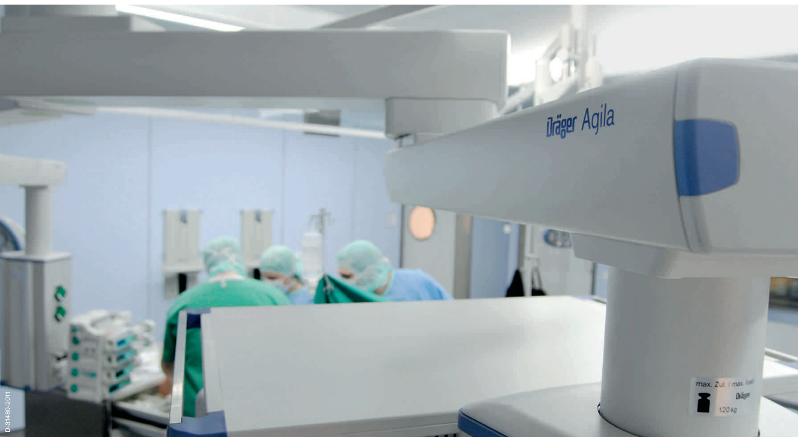
Подвесная система PONTA для отделения интенсивной терапии новорожденных