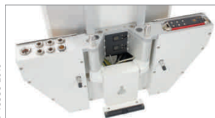
MediaDocking на консоли Movita