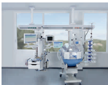
Палата неонатальной терапии с потолочной системой Ponta