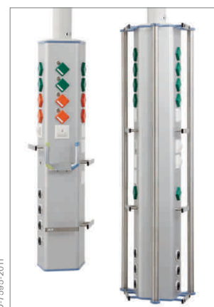
Консоль Agila (EasyLift и блок)